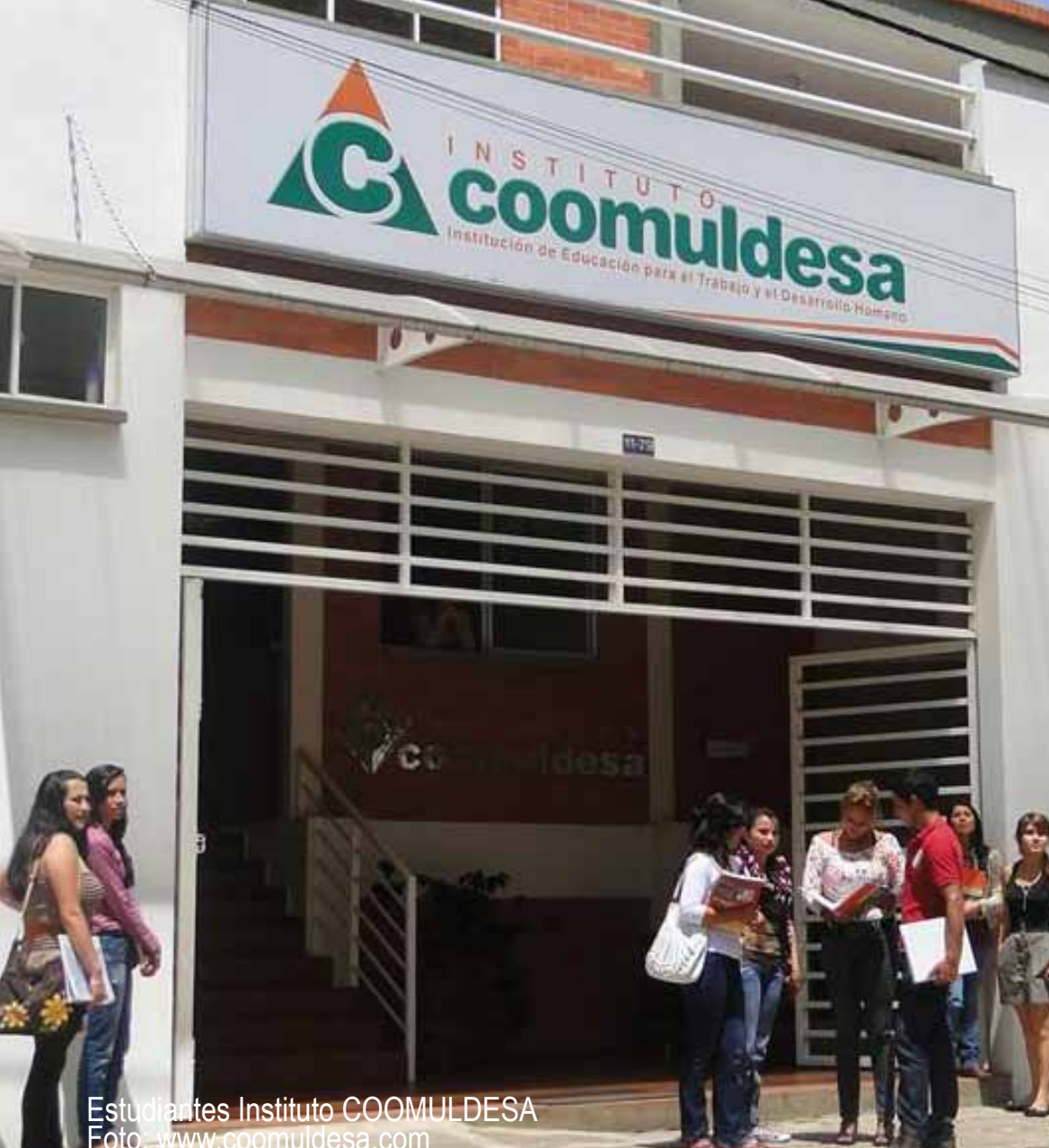
Estudiantes Instituto COOMULDESA

“El cooperativismo y la economía solidaria junto con nuestra identidad cultural y territorio son las variables a nuestro alcance para seguir construyendo un desarrollo más solidario que compite con el modelo basado en el desarrollo convencional”.