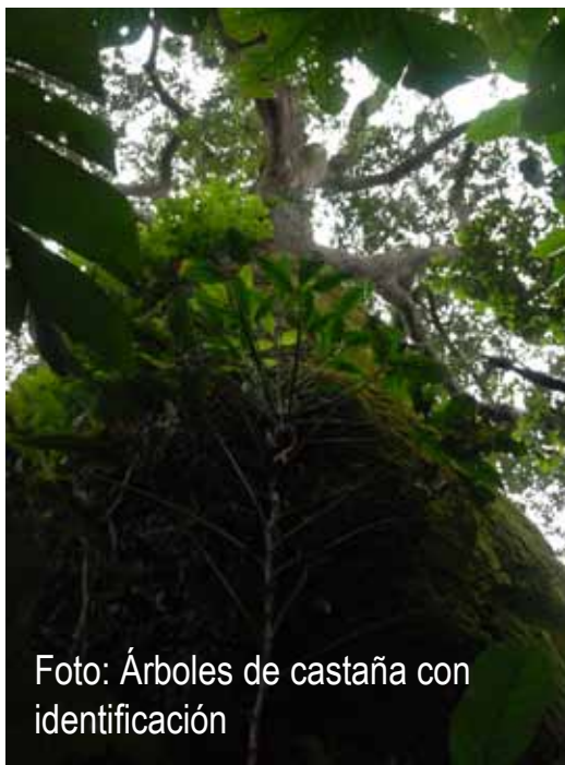
Foto: Árboles de castaña con identificación