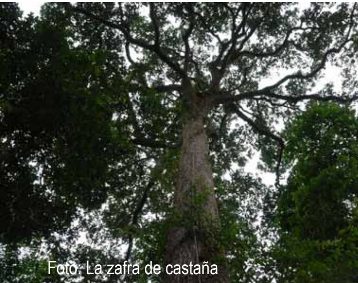
Foto: La zafra de castaña

La experiencia del territorio indígena Tacana II y su organización, en plena Amazonía boliviana es un testimonio fiel de posibilidades para defender su visión de desarrollo ante amenazas del extractivismo. Se trata de una resistencia con diálogo y propuesta, haciendo valer sus derechos, negociando la coexistencia con lógicas de desarrollo distintas.